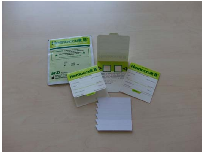
Test du dépistage (Hémoccult II), Simple et facile à réaliser chez soi

Le dépistage du cancer colorectal permet d'identifier la maladie à un stade très précoce de son développement et de détecter des polypes, avant qu'ils n'évoluent vers un cancer. Le test du dépistage (Hémoccult II) repose sur la recherche de traces de sang, souvent invisibles à l'œil nu, dans les selles. Il permet d'identifier les personnes porteuses d'une lésion du gros intestin qui saigne.